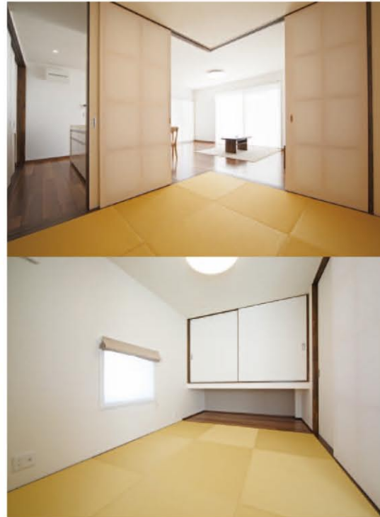
LDKと回遊できる、続き間のコーナー和室