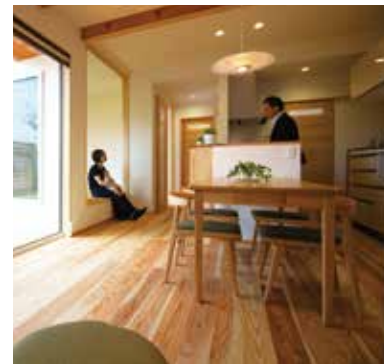
2 家族との距離が近く、常にコミュニケーションを図れるキッチン