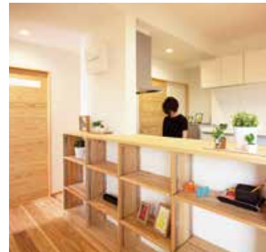
6 室内が片付く適材適所の収納