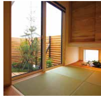
4 リビングとつながり、プライベートガーデンにも出られる小上がりの和室