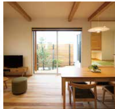
1 温もりのある杉の床と大開口の窓で外とつながるリビング

所在地:新潟県阿賀野市保田字千苺 / 交通:新潟交通「千苺団地前」バス停から徒歩約4分 / 土地面積: 185.61㎡ (56.14坪) / 延床面積 (1階): 74.39㎡ (22.54坪) / 建築面積: 80.73㎡ (24.46坪) / 施工面積: 94.51㎡ (28.63坪) / バス・トイレ: 追焚機能、シャワー付洗面化粧台、温水洗浄便座 / キッチン: システムキッチン、IHクッキングヒーター、3口以上コンロ / 設備・サービス: 全居室収納、エアコン2台、床下収納、モニター付インターホン、カードキー、複層ガラス、省エネ給湯器、室内物干し、上水道、下水道、電気、側溝、庭、ウッドデッキ、間接照明、照明器具、火災警報器 (報知機) / 道路幅員: 6.0m / 建築年月: 2018年6月新築 / 取引形態: 売主 / 広告取引有効期限: 2023年12月31日