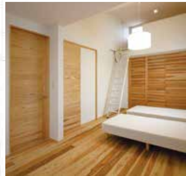
5 2部屋に区切ることもできるマルチな寝室