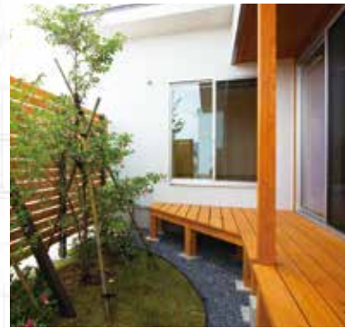
3 ひと目を気にせず時間を過ごせるプライベートガーデン