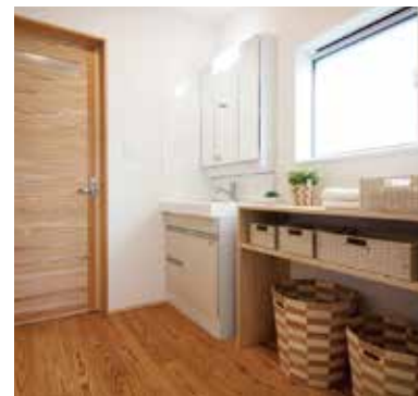
8 大容量のタオルや着替えを収納できる洗面脱衣室